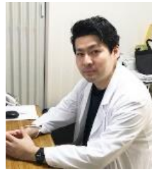
福田脳神経外科病院