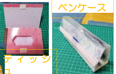
ティッシュケース