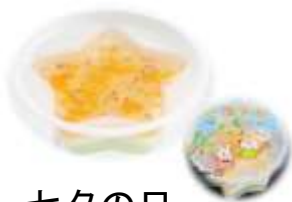
七夕の日 お星さまゼリー